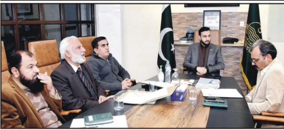
لاہور صوبائی وزیر ہارم مراد نے وزیر اعلیٰ پرویز خٹک کے ہمراہ ایک اجلاس میں شرکت کی ہے

ایف بی آر نے ملک بھر میں ریٹیلرز پر ٹیکس لگانے کی تیاریاں مکمل کر لی پبلسر نے سٹارٹ اپ بچے میں ٹیکس لگانے کا فیصلہ، 100 روپے آمدن کا تخمینہ 35 لاکھ ریٹیلرز ٹیکس لگانے کیلئے اسکیم تیار کی ہے، 300 روپے آمدن کا تخمینہ لاہور (این این آئی) فیڈرل بڈ آف ریٹیلرز نے ملک بھر میں ریٹیلرز پر ٹیکس لگانے کی تیاریاں مکمل کر لی ہیں، پبلسر نے سٹارٹ اپ بچے میں ٹیکس لگانے کا فیصلہ، 100 روپے آمدن کا تخمینہ، 35 لاکھ ریٹیلرز ٹیکس لگانے کیلئے اسکیم تیار کی ہے، 300 روپے آمدن کا تخمینہ۔