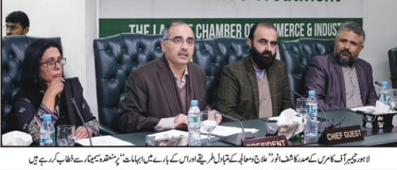
لاہور: چیف ایگزیکٹو آفیسر کے صدر کشف آؤٹ علاج سہولت کے بارے میں اجلاس میں شرکت کی ہے

سیدنا ابوبکر صدیق رضی اللہ عنہما اور حضرت نظام خلافت مسلمانوں کیلئے مشکل راہ ہے لاہور (این این آئی) سیدنا ابوبکر صدیق رضی اللہ عنہما اور حضرت نظام خلافت مسلمانوں کیلئے مشکل راہ ہے۔